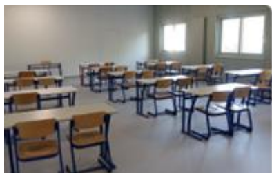
Etude des externes