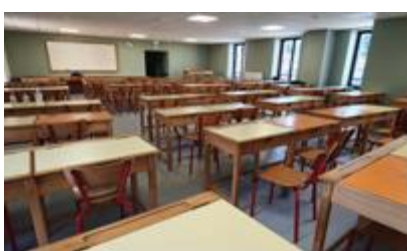
Etude des internes